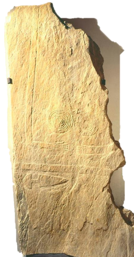
Figure 3- Stèle anthropomorphe n°2, Sion, nécropole du Petit-Chasseur, Néolithique