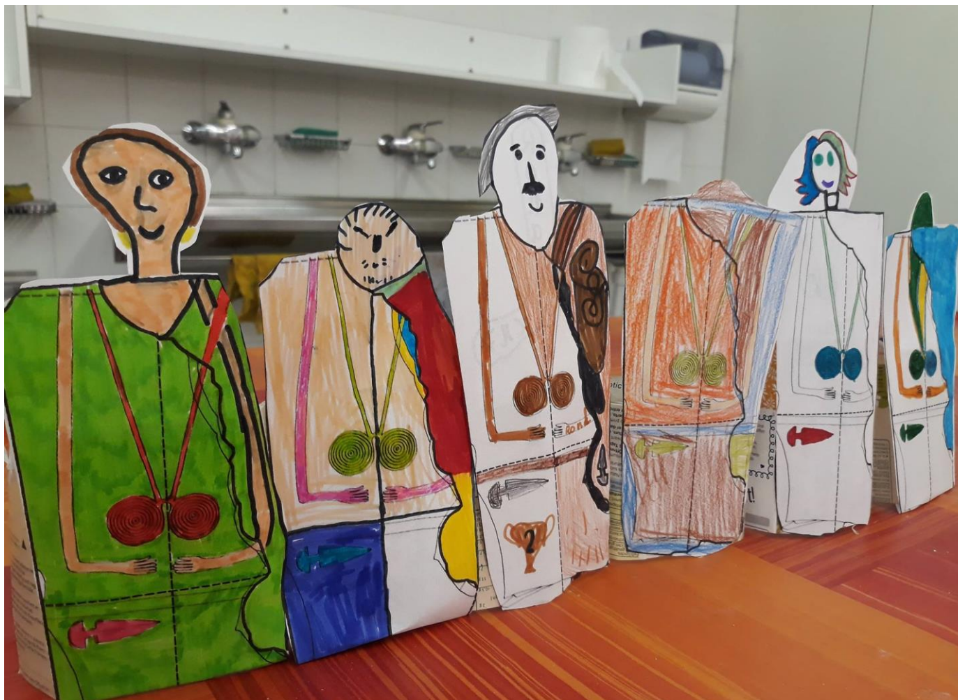
Figure 1 – Exemples des autres stèles de Sion (travaux des jeunes archéologues archéo-decouverte Martigny 2019)