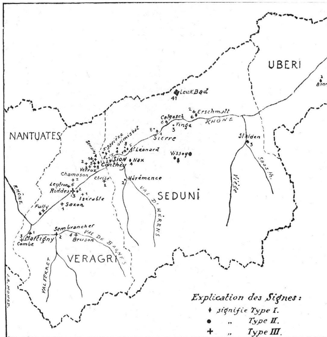
Figure 1 -répartition des bracelets D'après Viollier, D. 1929 "bracelets valaisans" Genava : revue d'histoire de l'art et d'archéologie