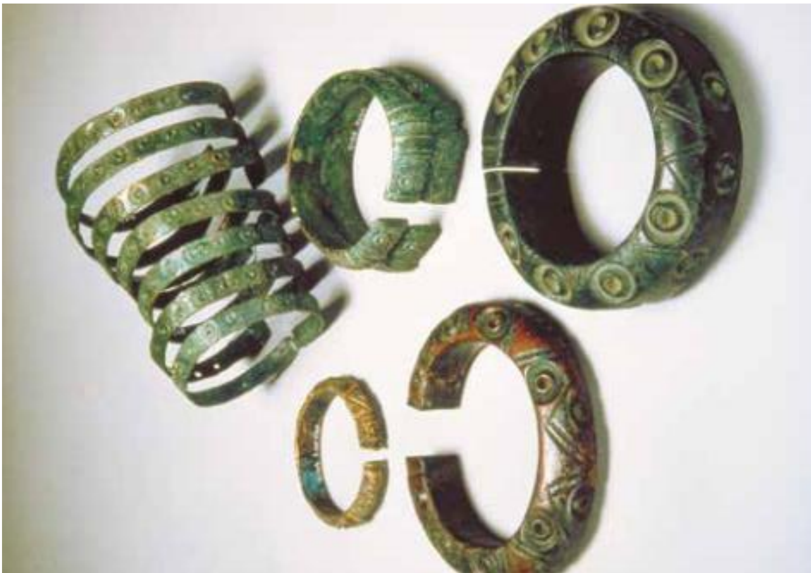
Figure 4 – D'après Des Alpes au Léman. Images de la préhistoire, Alain Gallay, 2008