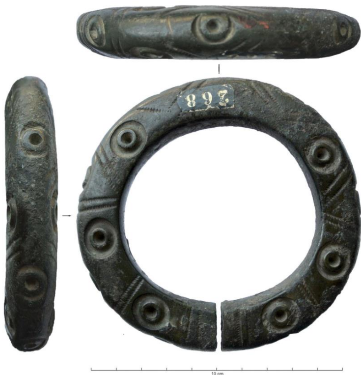
Figure 1-Musée Gallo-Romain de Fourvière [69] (FR), Lyon